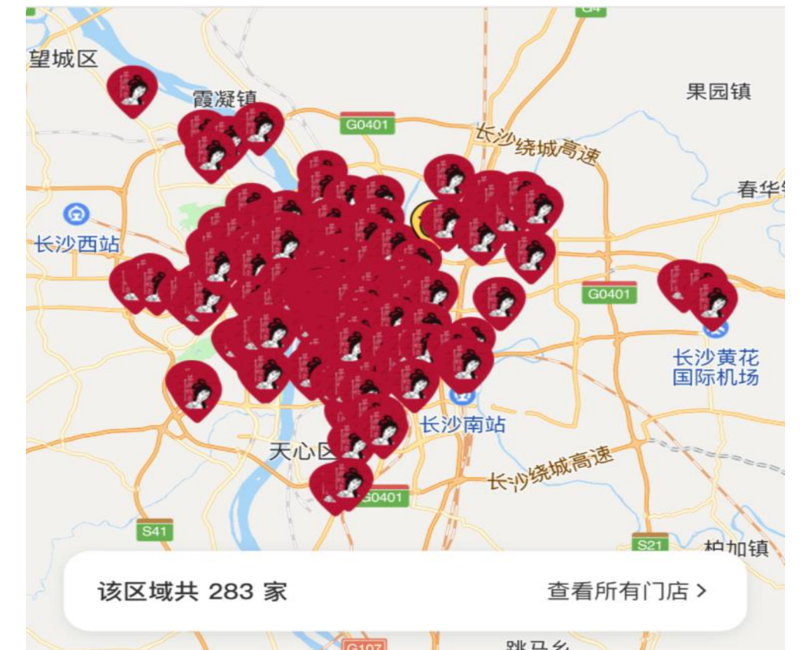
茶颜悦色长沙店铺分布图