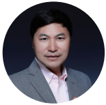
高红冰 阿里巴巴集团副总裁 阿里研究院院长