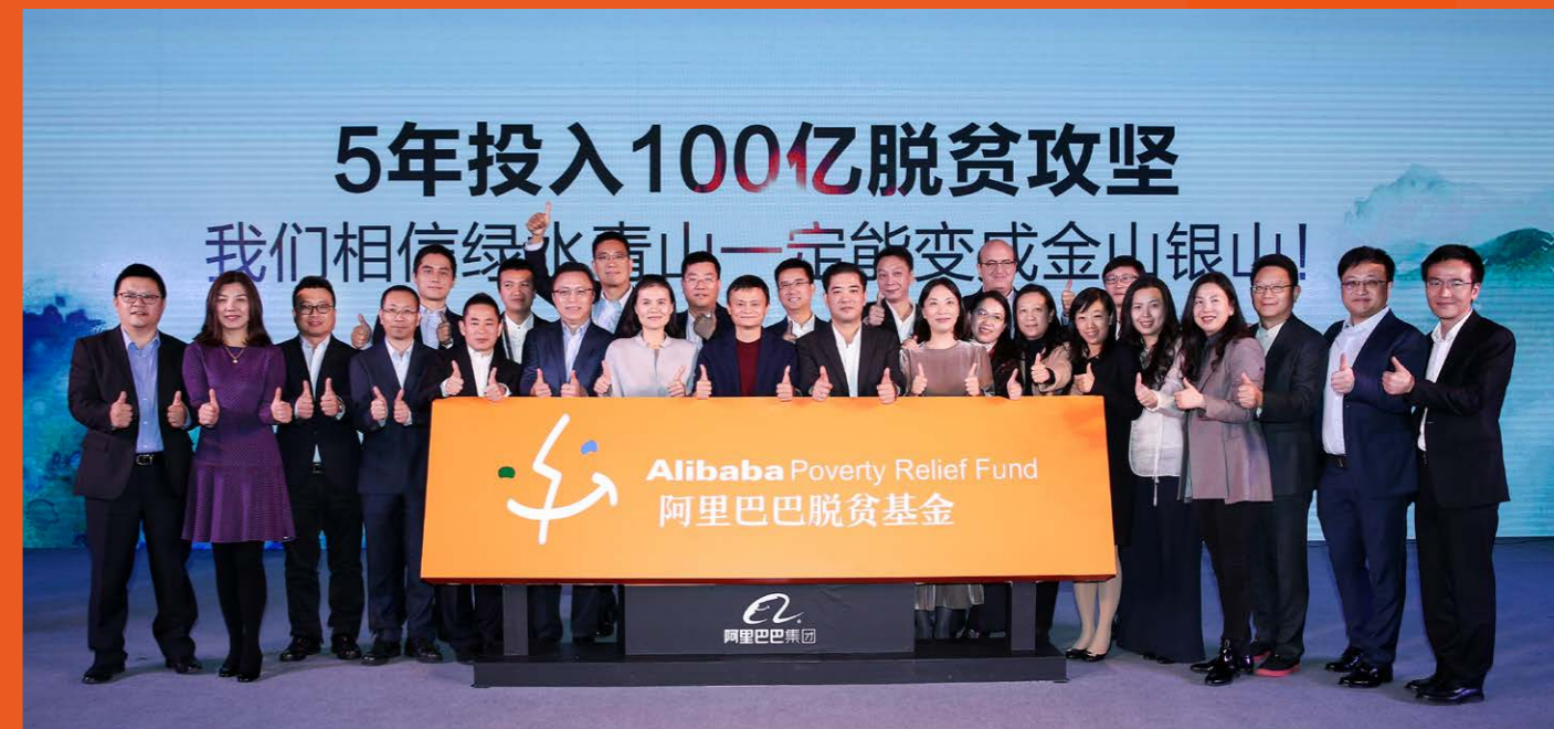
▲ 阿里巴巴脱贫基金成立

为了更好助力国家脱贫攻坚战，2017 年 12 月 1 日，阿里巴巴脱贫基金正式成立，计划未来 5 年投入 100 亿元助力脱贫攻坚。三年多来，阿里巴巴和蚂蚁集团持续加大人力、平台与技术资源投入，帮助农村实现脱贫致富，推动城乡融合发展，为实现共同富裕贡献力量，这背后是阿里巴巴普惠的本心，也是对“公益的心态、商业的手法”最深刻的诠释。阿里巴巴和蚂蚁集团在教育脱贫、健康脱贫、女性脱贫、生态脱贫、电商脱贫五大方向发力，探索并实践出“可持续、可参与、可借鉴”的互联网脱贫模式，助力乡村从脱贫走向致富。