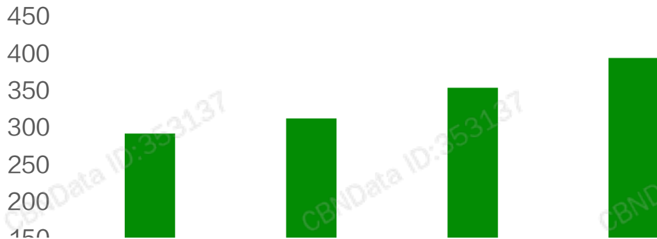
2015-2018 苏州汽车保有量变化 (单位: 万辆)