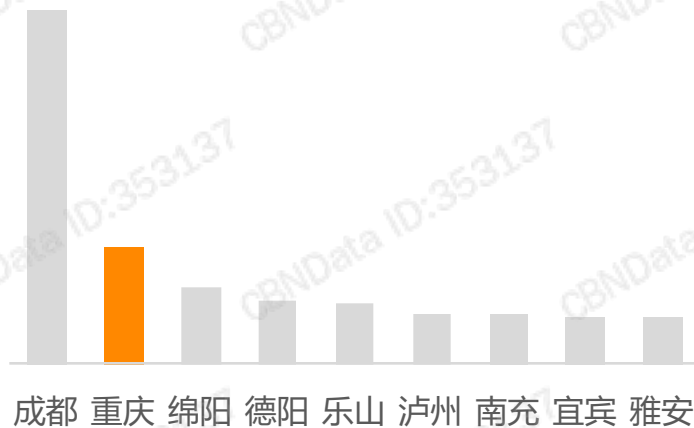
成渝地区智能出行渗透率排名

截止2016年9月，重庆地区有过打车出行记录的用户数超 500万 ，即约每 3个 重庆城镇居民中就有 1个 使用过滴滴打车出行