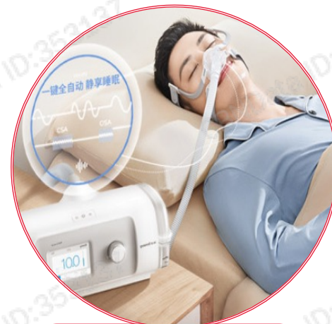
气道正压装置-呼吸机