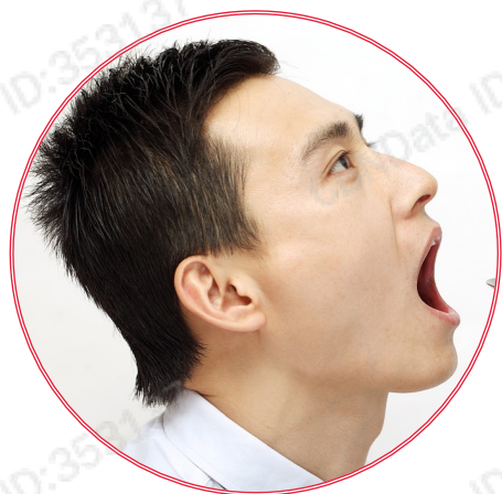
一般性治疗及行为措施

目前治疗OSA的方法大致分为四种，一般性治疗，手术，口腔矫正器及气道正压装置；结合各疗法副作用及适用性，首选有效的方式为呼吸机装置