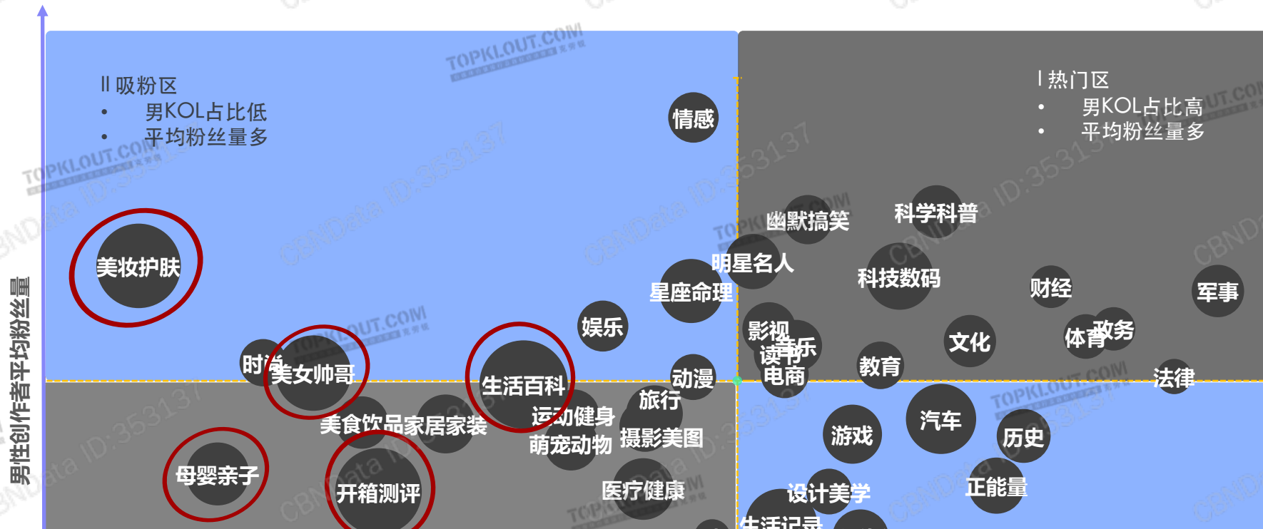
截至2021年9月微博男性创作者数量占比