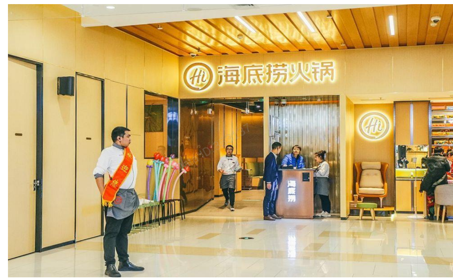
海底捞2020年全年净利润同比下降

·11月5日，“火锅第一股”海底捞决定“刮骨疗伤”，2021年底前关停300家门店，占门店总数的约20%