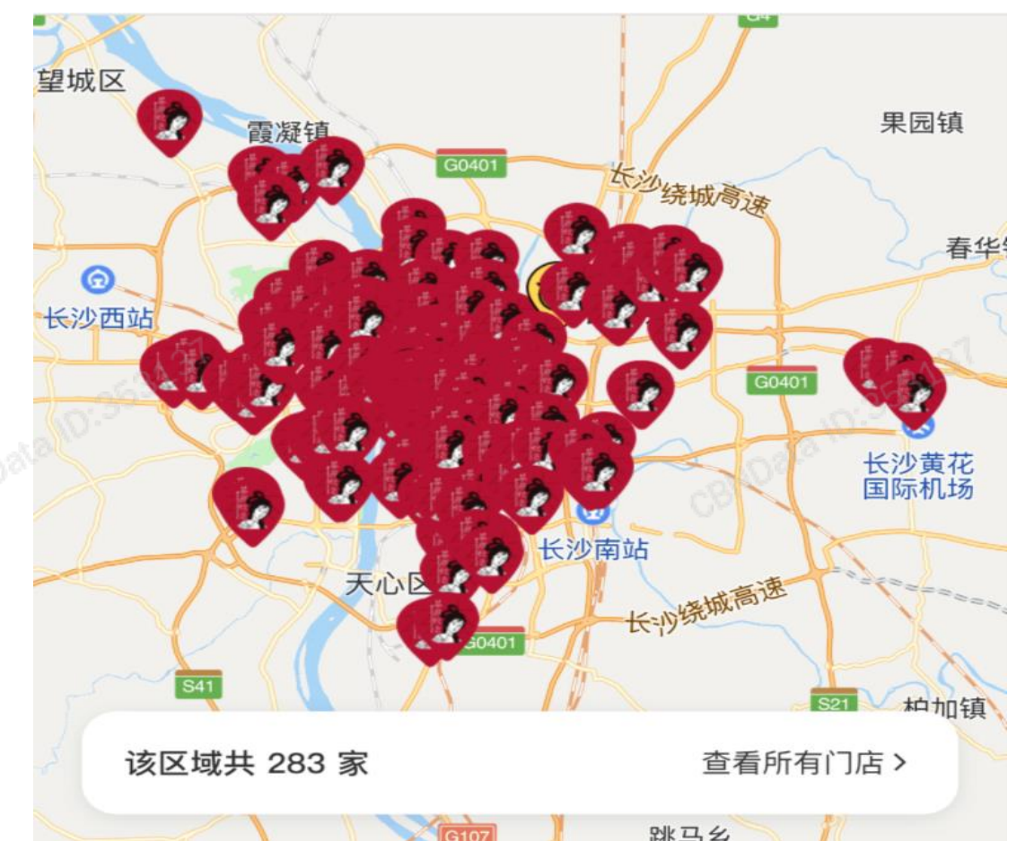
茶颜悦色长沙店铺分布图