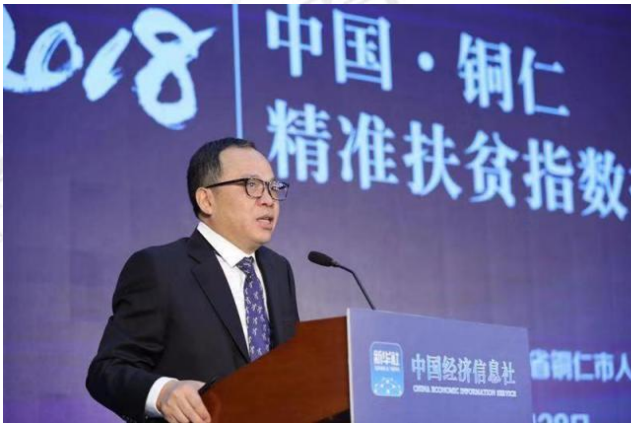
图为国务院扶贫办信息中心主任陆春生在 2018 中国·铜仁精准扶贫指数发布会上解读指数

“指数报告非常直观地记录了铜仁市在脱贫攻坚方面开展的工作，同时也用生动鲜活的数据展现了铜仁市在脱贫攻坚方面取得的成效。中国经济信息社利用扶贫开发数据开展了有效的数据分析，为铜仁市精准扶贫工作提供了决策支撑。” 国务院扶贫办信息中心主任陆春生说。