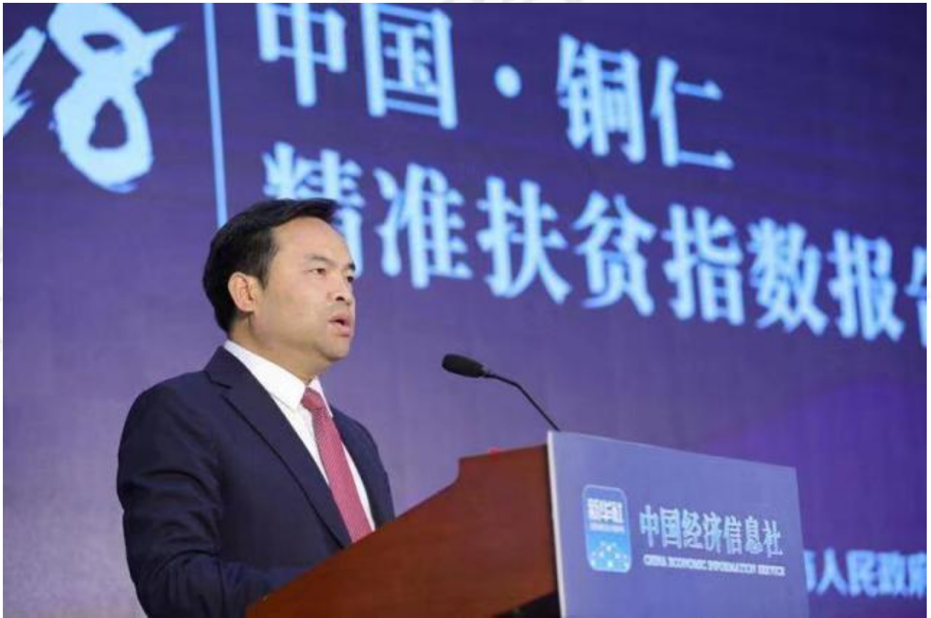
图为贵州省铜仁市委书记陈昌旭在 2018 中国·铜仁精准扶贫指数发布会上致辞

铜仁市委书记陈昌旭说，新华指数作为指数行业的旗舰，致力于研究客观反映我国经济社会发展的指数“晴雨表”，为各行业创新发展提供了参考样本。持续三年编制发布中国·铜仁精准扶贫指数报告，对铜仁脱贫攻坚工作进行精准度量，为打好打赢脱贫攻坚战提供了参考标尺、作出了重要贡献。