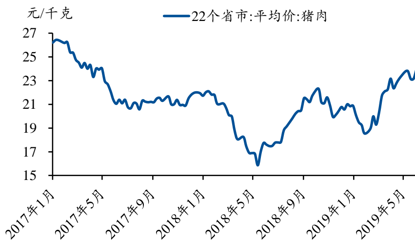
图 4：22 省猪肉平均价创新高