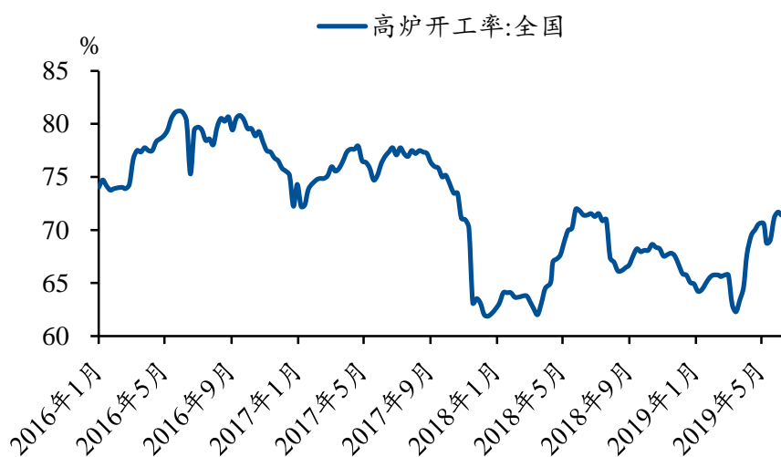
图 3: 5 月高炉开工率略微下降与去年同期持平

高炉开工率: 截至 6 月 6 日,全国高炉开工率为 71.41%,较上周末下降 0.28 个百分点,较去年同期持平 (图 3)。