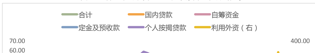
图 3：房地产开发企业各项资金来源增速

土地成交的好转，也与开发企业资金情况改善、拿地积极性提升有关。1-3 月份房地产开发企业到位资金 38948 亿元，同比增长 5.9%，增速比 1-2 月份提高 3.8 个百分点。其中国内贷款和自筹资金增速均“转正”，定金及预收款和个人按揭贷款增长明显加快。