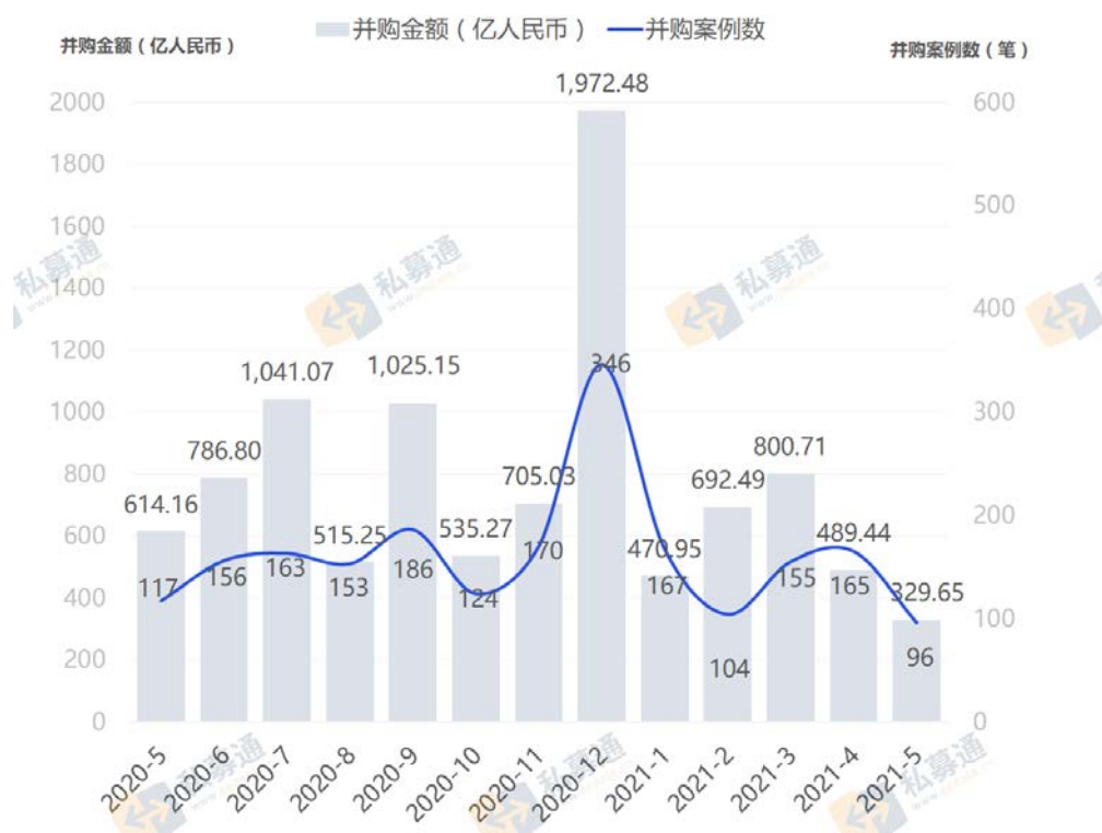
图 1 2020年5月至2021年5月并购市场交易趋势图

从并购交易类型来看，本月国内交易共发生94笔交易，占并购案例总数的97.9%，其中披露金额的案例68笔，总金额为319.31亿人民币；海外交易共发生2笔，其中披露金额的案例2笔，总金额为10.34亿人民币；本月交易金额较大的两笔并购案例为：深圳市桑达实业股份有限公司收购中国电子系统技术有限公司96.72%股权，交易金额为74.29亿人民币；北京首钢股份有限公司收购首钢京唐钢铁联合有限责任公司19.18%股权，交易金额为55.69亿人民币。