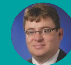
Conor Moore 毕马威私人及家族企业服务美洲区主管合伙人 毕马威私人及家族企业新兴巨头网络全球联席主管 毕马威美国合伙人