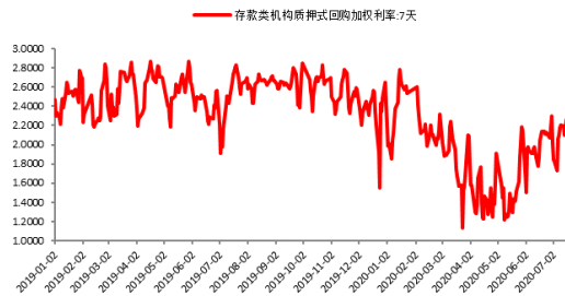
图 2：存款类机构质押回购利率（%）