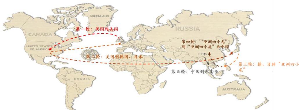
图表2 全球产业链的转移路径