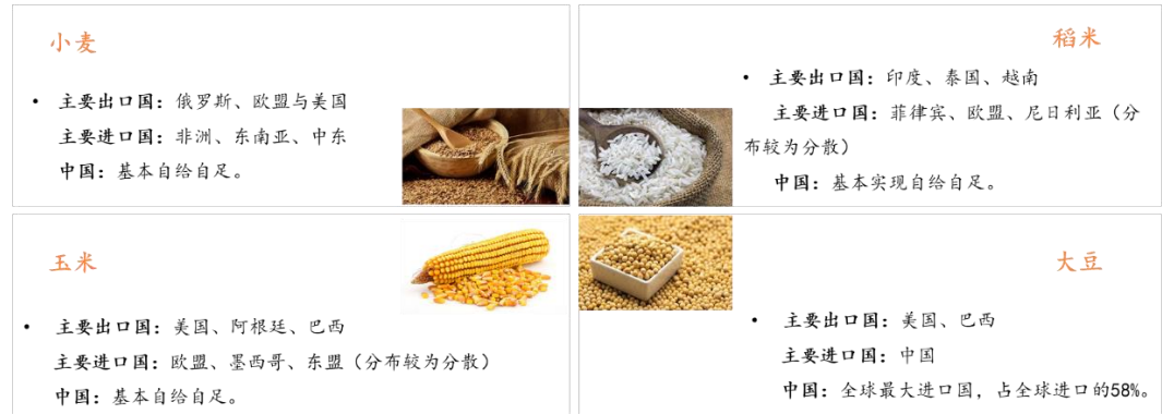
图表7 主要农产品产业链

环节。中国是主要的消费国；对大豆等经济作物的进口依赖度较高，稻米、小麦、玉米等粮食作物基本可以实现自给自足。