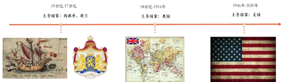
图表1 经济全球化的三大阶段

全球化的基础是产业链的国际分工。回顾历史，经济全球化共经历了三个黄金时期。在第一阶段（15世纪-17世纪），造船业的发展以及火药、指南针的出现开启了“大航海时代”，欧洲诸帝国以殖民地为基础建立起全球供应链，以农副业与手工业为主导产业，西班牙、荷兰是当时经济全球化的引领者。在第二阶段（18世纪-1914年），18世纪末英国成为全球霸主，号称“日不落帝国”，通过两次工业革命实现了产业的替代升级，经济全球化的主导行业也升级为工业制造业，法国、德国等也是当时经济全球化的引领者。在第三阶段（1946年-2020年），大萧条和两次世界大战导致全球化阶段性停滞；战后全球化重启，在1989年冷战结束以及科技革命推动下，全球化进入高峰，主导行业为电子、汽车、机械等，引领国为美国。但是，2008年全球金融危机的爆发减缓了全球化的进程。