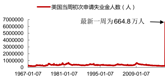
图 1：美国当周初次申请失业金人数

北京时间4月3日晚上，美国3月的非农就业数据将会公布。 这个数据的取样时间是截至3月中旬，也是大规模失业潮之前，因此无法反应近两周的失业潮，我们认为不具备太多的参考意义。但是，需要警惕的是，美国将在5月初发布的4月非农就业数据可能会再度出现极值。