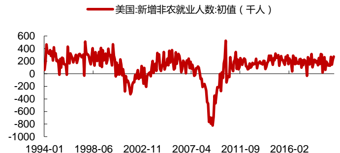
图 2：美国新增非农就业人数