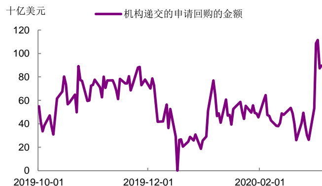
图 2：市场对隔夜流动性的需求仍然较高

非农数据未令美股止跌，市场仍预期联储会继续降息。 尽管 2 月非农表现靓丽，但数据公布后美股依旧下跌，三大股指跌幅均一度超过 3%。一方面，市场认为 2 月的就业数据并不能完全反映疫情的影响。另一方面，投资者对经济下行和流动性风险的担忧仍在，纽约联储隔夜回购窗口接纳的证券仍处于较高水平，反映市场对流动性的需求仍然较高（图 2）。非农数据公布后，市场预期的联储 3 月降息的概率不变，仍为 100%（图 3）。