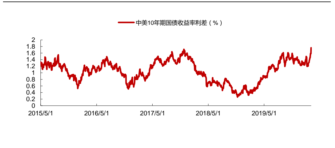
图 2: 中美 10 年期国债收益率利差 (%)