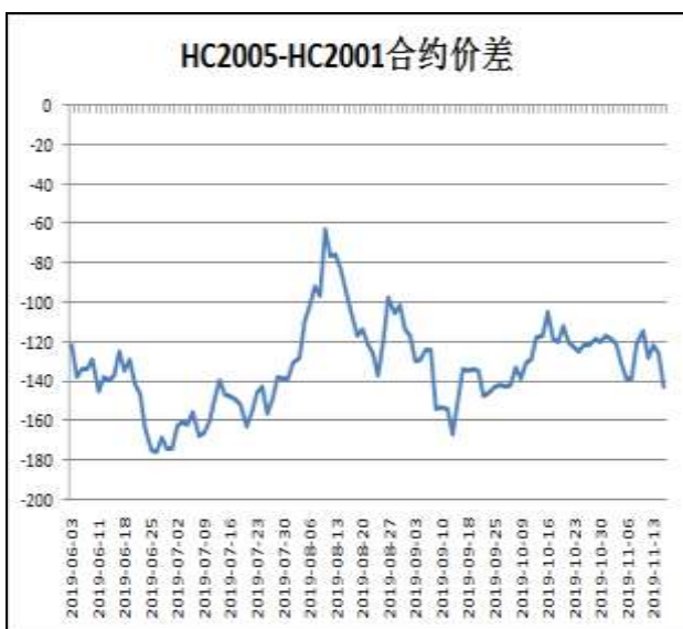
图6：本周热卷弱于螺纹，价差扩大