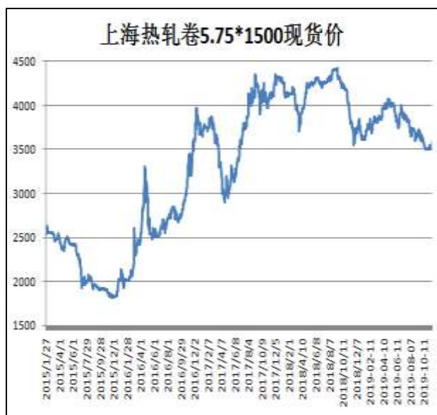
图1：本周热卷现货价反弹