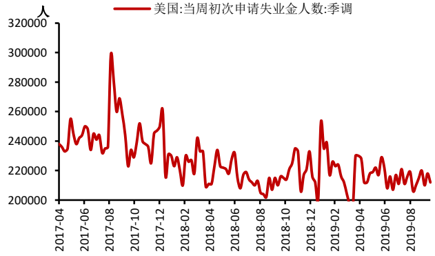
图表 2: 美国当周初次申请失业金人数