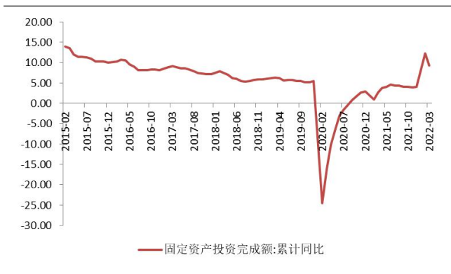
图 5：固定资产投资总额累计增速（%）