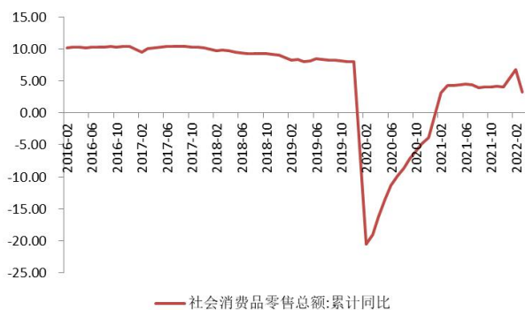
数据来源：Wind，山西证券研究所