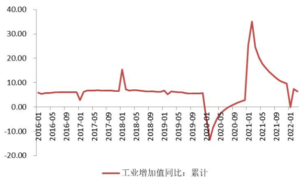
数据来源：Wind，山西证券研究所