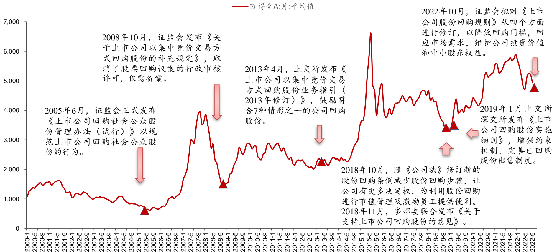
图：历次《回购规则》修订时点对应股市变化