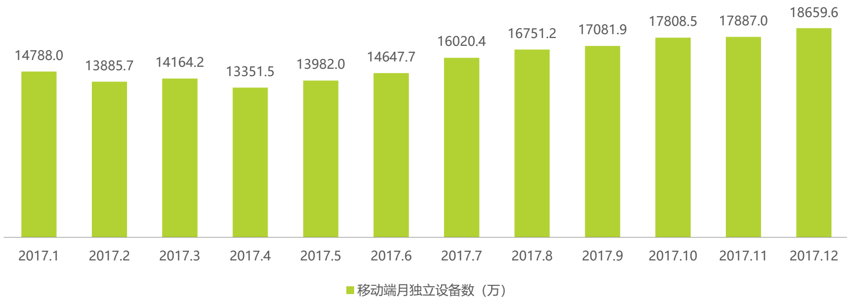
mUserTracker-2017年1月-12月移动端办公服务软件月独立设备数