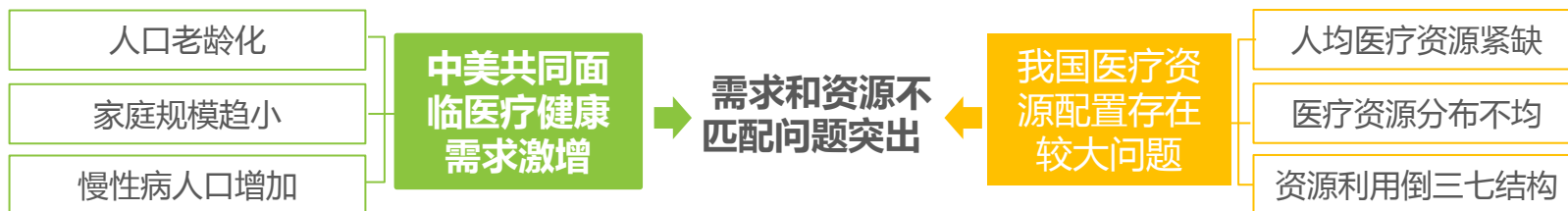
2015年中国和美国医疗健康产业特点和发展路径对比