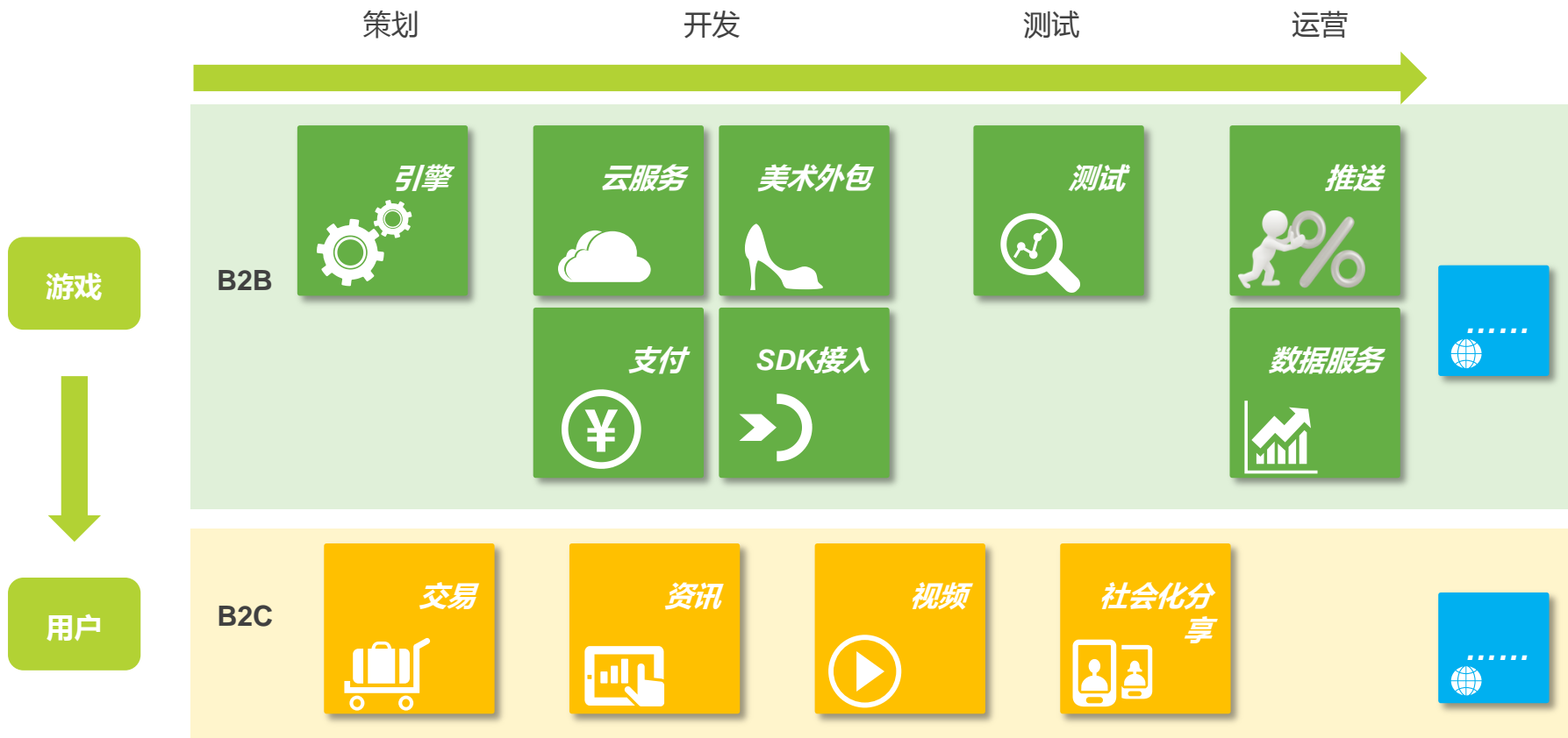
中国移动游戏第三方服务产业链图

移动游戏行业高速发展，产业链上也出现了众多创新型的第三方服务公司，服务于移动游戏运营商和用户。