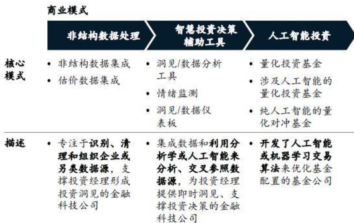
图3 在投资管理领域，金融科技主要应用在三大方面

如何通过大数据应用产生的洞见赋能主动投资或者量化投资是全球领先资管公司科技投入的重点领域。其中非结构数据的采集和分析、人工智能投资技术的探索和应用是重中之重（见图 3）。