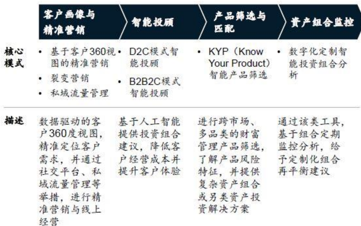
图2 在财富管理领域，金融科技主要应用在四大方面