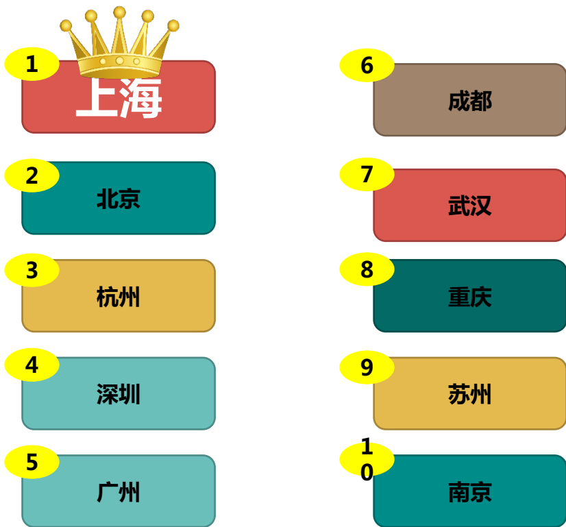
天猫双11全国各市成交额排行TOP10

阿里数据显示，参与2017天猫双11的剁手城市中，上海、北京、杭州、深圳已然组成“新一线”城市，成交额雄踞全国前四