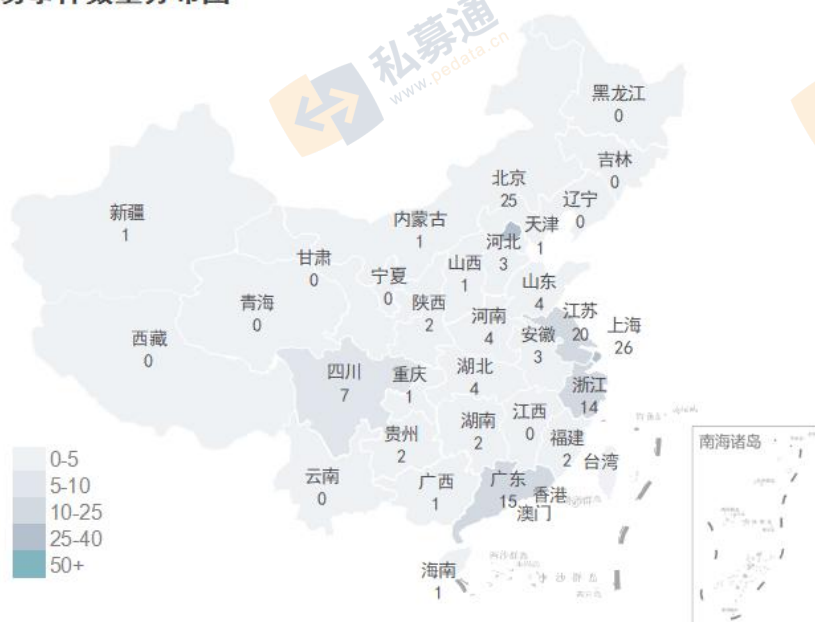
5月交易事件数量分布图

清科私募通统计：截至本周周五下午，投资、上市和并购共 92 起事件，涉及总金额 422.50 亿元人民币。从交易金额来看，本周金额较大事件是：2020 年 5 月 15 日，中邮证券有限责任公司、富国基金管理有限公司、光大保德信资产管理有限公司、平安资产管理有限责任公司、中国华融资产管理股份有限公司等投资宁波银行股份有限公司 80.00 亿人民币。从交易事件地域分布看，目前主要分布在上海市、北京市和江苏省，占比分别为 18.2%，17.5%和 14.0%。