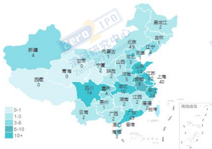
12月交易事件数量地域分布图

清科私募通统计：截至本周五下午，投资、上市和并购共 106 起事件，涉及总金额 1201.79 亿元人民币。从交易金额来看，本周金额较大事件是：2019 年 12 月 20 日，武汉中商集团股份有限公司成功受让北京居然之家投资控股集团有限公司、霍尔果斯慧鑫达建材有限公司、阿里巴巴（中国）网络技术有限公司等共 22 位持有的北京居然之家家居新零售连锁集团有限公司 100%的股权。从交易事件地域分布看，目前主要分布在北京市、广东省和上海市，占比分别为 17.2%，17.2%和 14.0%。