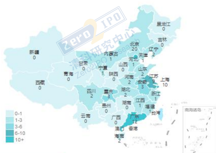
12月交易事件数量地域分布图

清科私募通统计：截至本周五下午，投资、上市和并购共 85 起事件，涉及总金额 340.25 亿元人民币。从交易金额来看，本周金额较大事件是：2019 年 12 月 2 日，广东奥园科技集团有限公司、中信保诚基金管理有限公司、中国电力建设股份有限公司、普洛斯投资（上海）有限公司、光大保德信资产管理有限公司等投资上海临港控股股份有限公司 47.67 亿人民币。从交易事件地域分布看，目前主要分布在北京市、广东省和上海市，占比分别为 25.0%，15.0%和 12.5%。