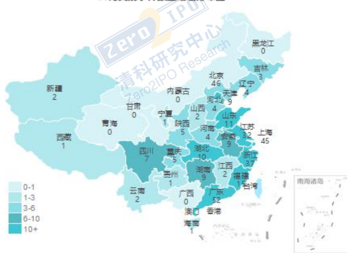
11月交易事件数量地域分布图

清科私募通统计：截至本周五下午，投资、上市和并购共 89 起事件，涉及总金额 1322.61 亿元人民币。从交易金额来看，本周金额较大事件是：2019 年 11 月 29 日，秦皇岛天业通联重工股份有限公司成功受让邢台晶骏宁显企业管理咨询中心（有限合伙）、宁晋县其昌电子科技有限公司、靳军淼、邢台晶礼宁华企业管理咨询中心（有限合伙）、宁晋县博纳企业管理咨询中心（有限合伙）等持有的晶澳太阳能有限公司 100% 的股权，作价 75.00 亿人民币。从交易事件地域分布看，目前主要分布在广东省、北京市和上海市，占比分别为 15.7%，13.9% 和 13.6%。