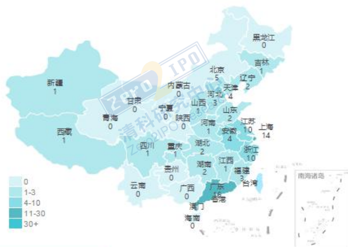
11月交易事件数量地域分布图

清科私募通统计：截至本周五下午，投资、上市和并购共 96 起事件，涉及总金额 245.64 亿元人民币。从交易金额来看，本周金额较大事件是：2019 年 11 月 4 日，深圳市基础设施投资基金合伙企业（有限合伙）、中非发展基金有限公司投资招商局港口集团股份有限公司 22.13 亿人民币。从交易事件地域分布看，目前主要分布在广东省、上海市和浙江省，占比分别为 18.2%，15.9%和 11.4%。