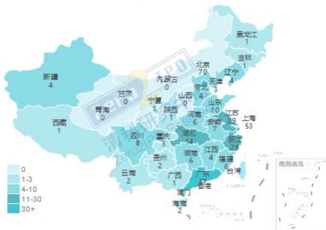
10月交易事件数量地域分布图

清科私募通统计：截至本周五下午，投资、上市和并购共 106 起事件，涉及总金额 346.56 亿元人民币。从交易金额来看，本周金额较大事件是：2019 年 10 月 29 日，蛋壳公寓完成了 1.90 亿美元（折合人民币约：13.44 亿元）的 D 轮融资，本轮融资由华人文化产业投资基金和春华资本投资。从交易事件地域分布看，目前主要分布在北京市、广东省和上海市，占比分别为 20.8%，16.9%和 15.7%。