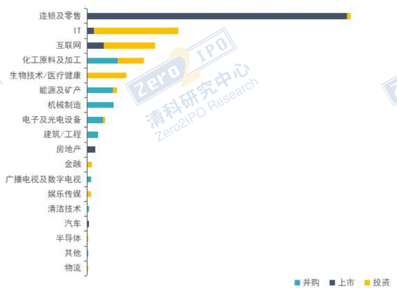
本月整体事件行业披露金额对比 (单位: 万元人民币)