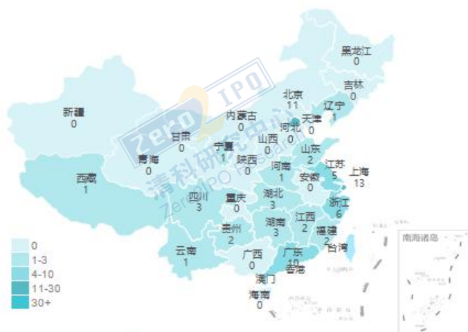
10月交易事件数量地域分布图

清科私募通统计：截至本周六下午，投资、上市和并购共 70 起事件，涉及总金额 172.79 亿元人民币。从交易金额来看，本周金额较大事件是：2019 年 10 月 8 日，本来集团已完成 D1 轮融资，金额达 2 亿美元（折合人民币约：14.16 亿元），本轮融资由明德控股领投，北京电商投资以及老股东鼎晖资本、高榕资本等跟投。从交易事件地域分布看，目前主要分布在上海市、北京市和广东省，占比分别为 19.4%，16.4%和 14.9%。