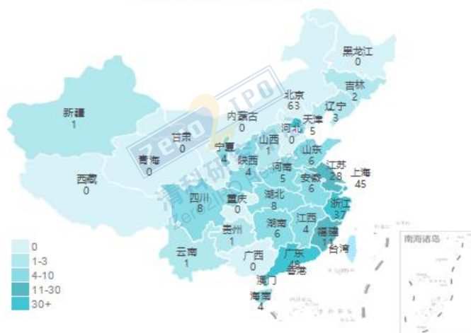
9月交易事件数量地域分布图

清科私募通统计：截至本周日下午，投资、上市和并购共 117 起事件，涉及总金额 663.02 亿元人民币。从交易金额来看，本周金额较大事件是：2019 年 9 月 26 日，羅特克斯有限公司成功受让河南双汇投资发展股份有限公司的 59.4% 的股权，作价 390.91 亿人民币。从交易事件地域分布看，目前主要分布在北京市、广东省和上海市，占比分别为 20.4%，15.5% 和 14.6%。