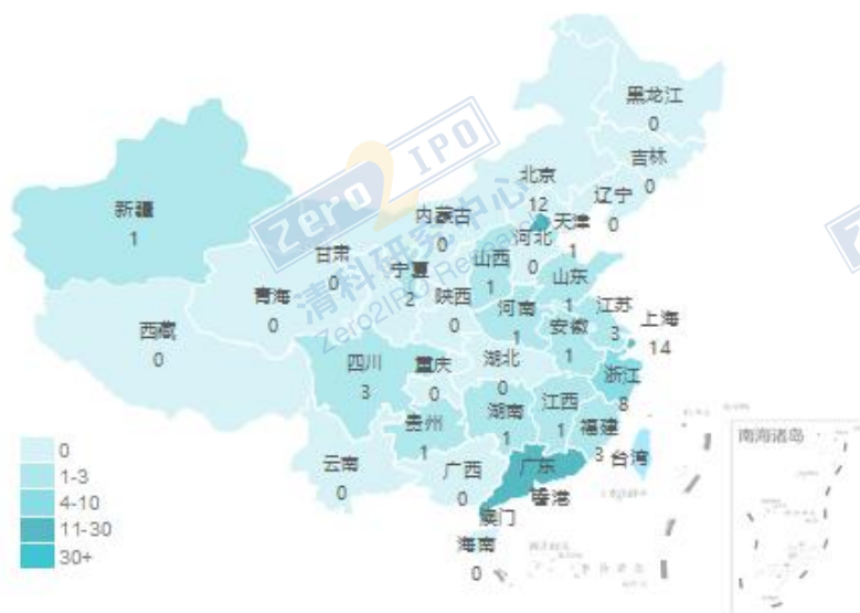
9月交易事件数量地域分布图

清科私募通统计：截至本周五下午，投资、上市和并购共 79 起事件，涉及总金额 127.86 亿元人民币。从交易金额来看，本周金额较大事件是：2019 年 9 月 6 日，网易云音乐获 7.00 亿美元 B2 轮融资，本轮融资由阿里巴巴、云锋基金等投资。本轮融资后，网易公司将继续大力支持网易云音乐的发展，助推中国原创音乐人创作出更好的作品。从交易事件地域分布看，目前主要分布在广东省、上海市和北京市，占比分别为 20.6%，19.2%和 16.4%。