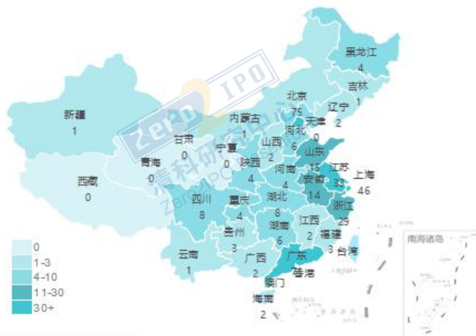
8月交易事件数量地域分布图

清科私募通统计：截至本周五下午，投资、上市和并购共 102 起事件，涉及总金额 292.89 亿元人民币。从交易金额来看，本周金额较大的投资事件是：2019 年 8 月 27 日消息，快看漫画获得腾讯 1.25 亿美元（折合人名币约：8.85 亿人民币）投资，光源资本继续担任本轮融资的独家财务顾问。快看和腾讯接下来将强化相关业务部门方面的合作。从交易事件地域分布看，目前主要分布在北京市、广东省和上海市，占比分别为 21.3%，20.2%和 13.1%。