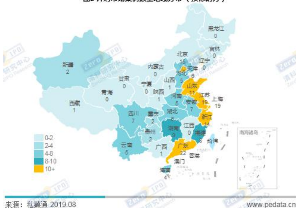
图2 并购市场案例数量地域分布（按标的方）

具体来看，2019年7月并购市场共完成188笔并购交易，按被并购企业所属省份来看，188笔交易分布在北上广以及江浙等37个省市、自治区以及香港和海外地区。从案例数量来看，上海市和江苏省并列第一，分别完成19笔并购交易，分别占本月并购案例数量的10.1%；