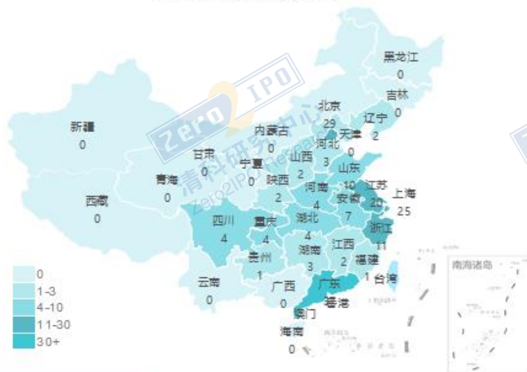
8月交易事件数量地域分布图

清科私募通统计：截至本周五下午，投资、上市和并购共 80 起事件，涉及总金额 134.41 亿元人民币。从交易金额来看，本周金额较大的投资事件是：2019 年 8 月 12 日，知乎完成 F 轮融资，总额 4.34 亿美元（折合人民币约 30.44 亿）。本轮融资由快手领投、百度跟投，腾讯和今日资本原有投资方继续跟投。从交易事件地域分布看，目前主要分布在广东省、北京市和上海市，占比分别为 20.3%，15.9%和 13.7%。