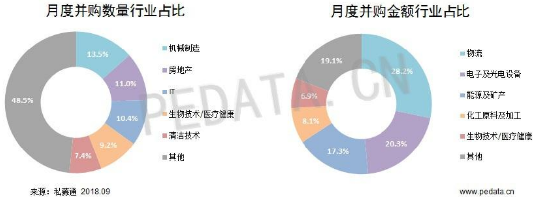
图3 并购市场行业分布（按标的方）

本月并购交易共涉及 22 个一级行业，从案例数量来看，机械制造行业居第一位，共完成 22 笔并购交易，占本月案例数量的 13.5%；房地产行业位居第二位，共完成 18 笔交易，占本月案例数量的 11.0%；IT 行业位居第三位，共完成 17 笔交易，占本月案例数量的 10.4%。