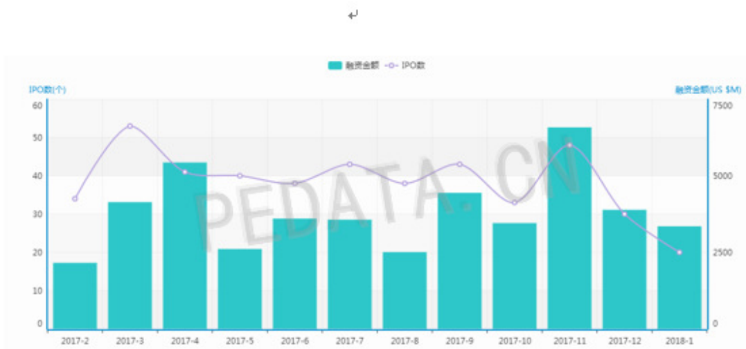
图 1 IPO 数量和融资金额月度走势

根据清科旗下私募通数据显示，2018 年 1 月全球共有 20 家中国企业完成 IPO，IPO 数量环比减少 33.3%，同比减少 66.7%。中企 IPO 总融资额为 33.50 亿美元，融资额环比减少 13.9%，同比减少 14.3%。本月完成 IPO 的中企涉及 12 个一级行业，登陆 5 个交易市场，中企 IPO 平均融资额为 1.68 亿美元，单笔最高融资额 7.63 亿美元，最低融资额 673.08 万美元。20 家 IPO 企业中 12 家企业有 VC/PE 支持，占比 60.0%。本月金额最大的三起 IPO 案例为：甘肃银行上市（7.63 亿美元），正荣地产上市（5.12 亿美元），红星美凯龙上市（4.74 亿美元）。2018 年 1 月 IPO 过会率再创新低，仅为 40%；20 家 IPO 中企中新三板转板企业 5 家，转板 IPO 比例增加。其主要原因有：一、发审会对上会的 IPO 项目审核更加严格，更加关注 IPO 项目的合规性，优质的新三板企业受到青睐；二、目前退市制度还有待完善，因此发审委必须严格把控上市企业的质量，除了关注真实性和信息披露是否充分之外，还需要在企业持续盈利能力和合规性等方面把控好。