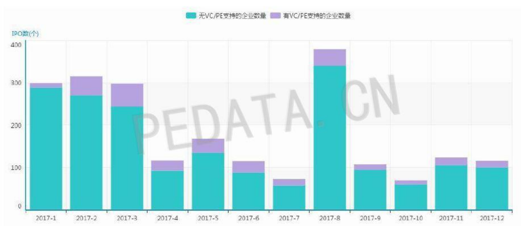
图 1 新三板挂牌企业月度走势

根据清科旗下私募通统计，截至 2017 年 12 月新三板挂牌企业数量达到了 11630 家，基础层企业 10277 家，创新层企业 1353 家。从转让方式来看，采用协议转让方式 10287 家，采用做市转让方式 1343 家。本月新增挂牌企业共 115 家，环比降低 6.5%，在所有挂牌企业中，有 VC/PE 支持的共有 16 家，占比 13.9%，环比下降了 11.1%。