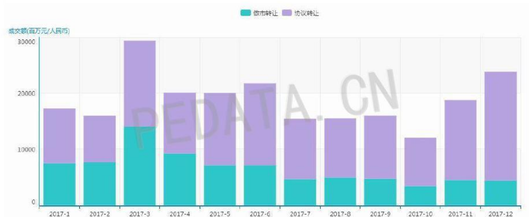
图 2 新三板成交月度走势

步，在中国资本市场发展的历程中，未来更多制度性红利的到来使得新三板将会在 2018 年迎来发展的黄金期。