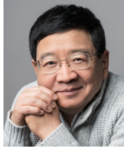
徐小平 真格基金 创始人