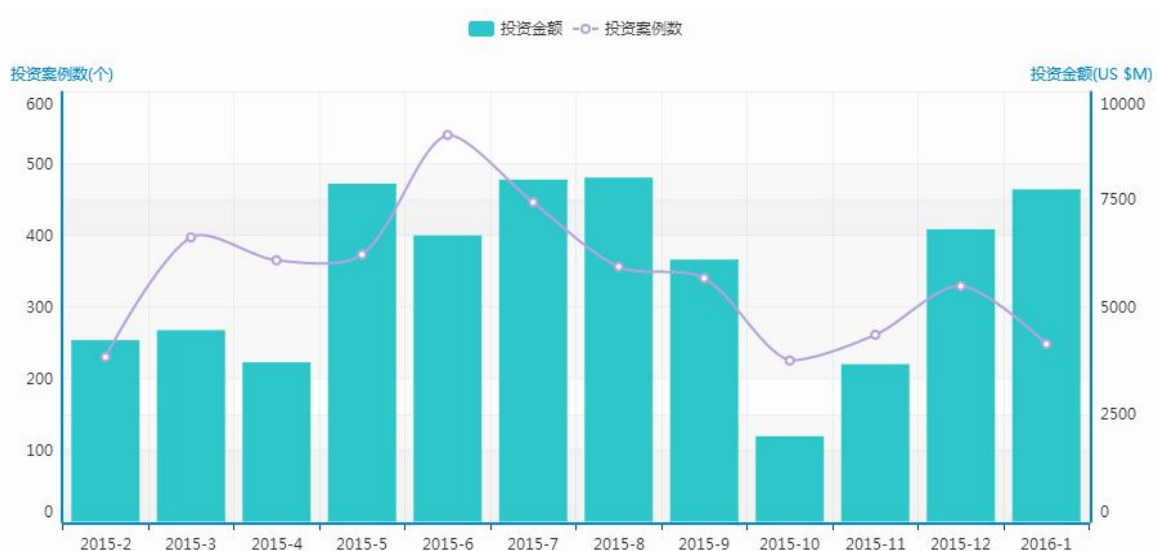
图 1 总投资数量和金额月度走势

1 月 15 日，国务院发文力促普惠金融。从发展农村电商到推进农村一二三产业融合，再到推进普惠金融的发展规划，政策导向一直在关心最根本的民生问题。因此在陆金所、京东金融和蚂蚁金服强势融资后，微众银行依旧能顺势获得资本青睐，1 月 20 日，美国私募基金华平投资和新加坡淡马锡斥资 4.5 亿美元砸向微众银行。微众银行主要针对个人及小微企业发放短期、中期和长期贷款，办理国内外结算以及票据、债券、外汇、银行卡等业务，其业务范围几乎与“普惠金融”完全一致。