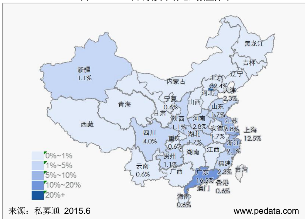
图3 2015.5 中国投资市场地区数量分布

从投资地域上看，2015年5月共发生投资案例176起，分布在北京市、上海市、深圳市、浙江省和江苏省等21个省市。其中前三甲分别是北京市、上海市和深圳市，案例数量占比分别为32.4%、12.5%和11.9%，金额分别为11.27亿、15.43亿和3.99亿美元，占比分别为21.1%、28.8%、7.5%；累计占比57.4%。热门投资地域北上广深占比依旧近六成，但江浙地区较上月增加20.0%，投资行业也不断多样化，除互联网、电信及增值业务和IT外，也加速了在生物技术/医疗健康、房地产和清洁技术的布局，例如靶点药物、上元堂、苏州新区高新技术和佳力科技等。