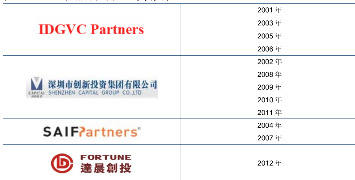
表 1 2001-2012 年历届中国最佳 VC 投资机构

达晨创投、华登国际、君联资本、兰馨亚洲、软银、上海永宣、SAIF；另外有 18 家机构上榜两次；而高达 81 家机构在这三年中仅仅上榜一次。足见，在十余年的发展中，有多少优质机构湮没于市场浪潮中，又有多少后起之秀迎头赶上。