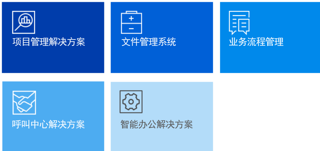
图 4：智能捷创平台应用场景和案例

智能捷创平台提供既有的可视化模型、预配置表单和模板，使组织能够构建可用的应用程序。我们在下面展示了几个用例场景。这些场景都可以使用该平台进行开发、实施、运营和管理（参见图 4）。