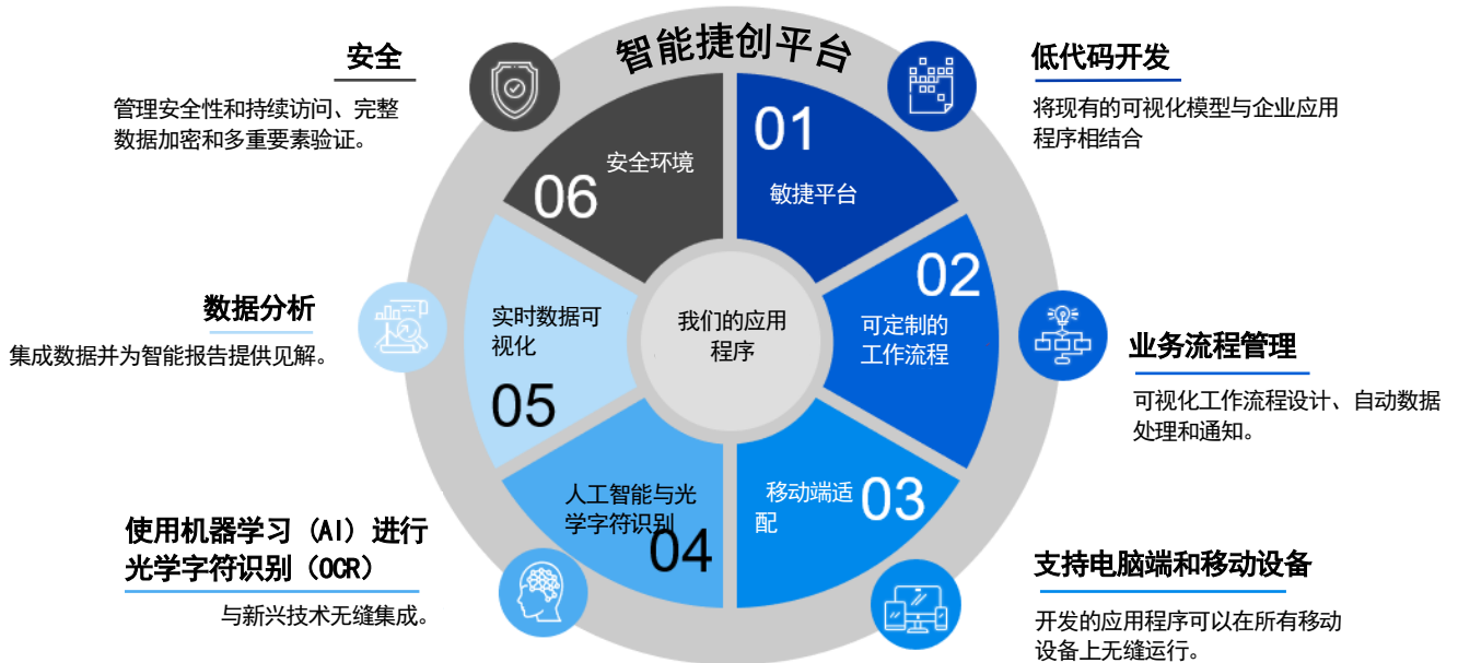
图 3：快照：智能捷创平台如何帮助加速 IT 项目