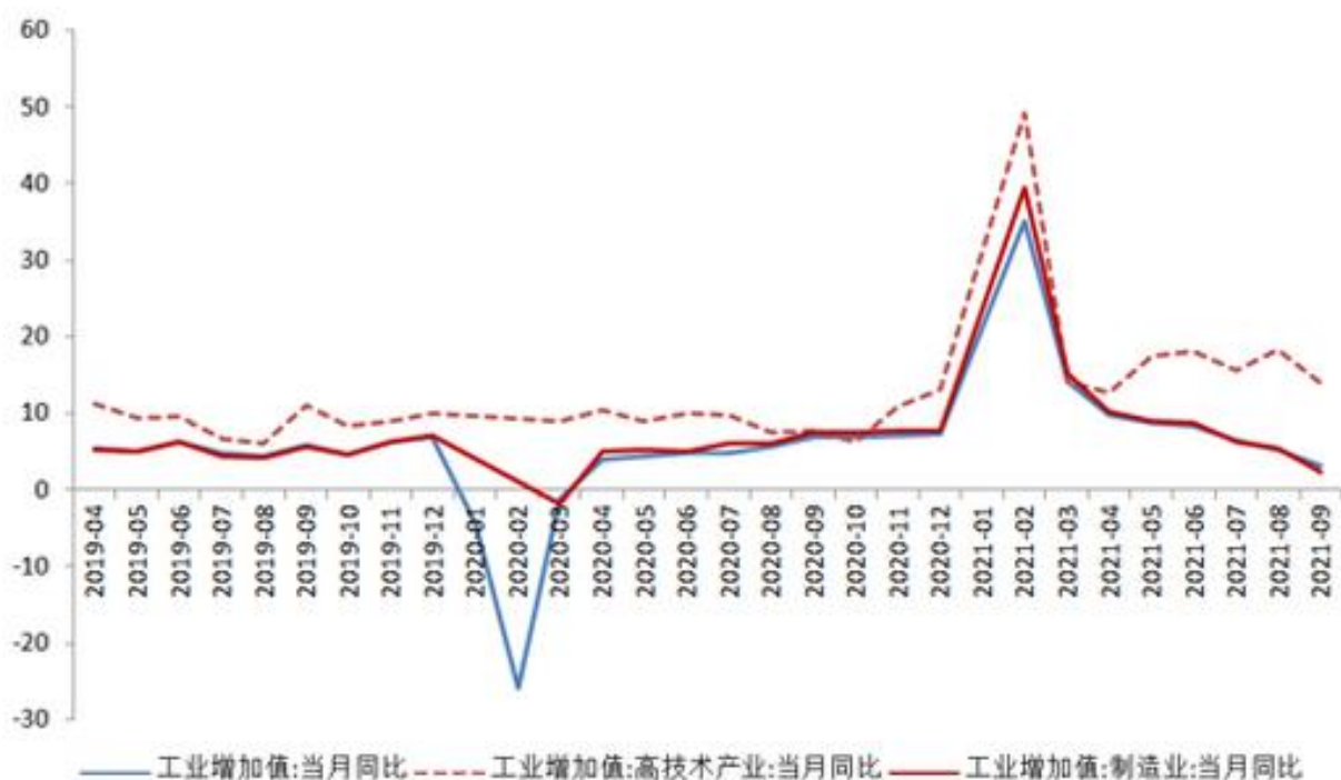
图 1 工业、制造业和高技术产业增速