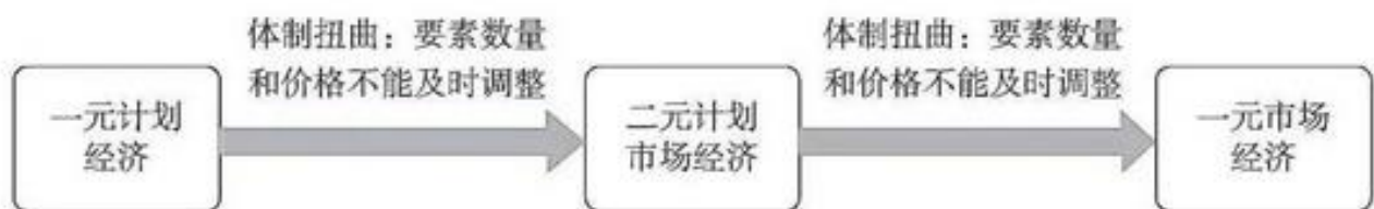
图 1 体制扭曲与体制剩余

计划体制, 或者一元计划与二元“计划—市场”体制中的扭曲和摩擦, 往往造成要素利用的 (闲置和浪费) 剩余, 结果是要素利用的低效率 (如图 1 所示)。中国体制从一元到二元, 再从二元到一元的渐进改革, 实际上就是通过二元体制转型使得资源和要素的体制性剩余得到利用并提高利用率, 使改革形成新潜能, 推动经济增长和发展的过程。二元体制扭曲, 通过改革不断的变通进行纠正; 而最后实在纠正不了的, 甚至二元扭曲体制形成了新的体制性剩余, 则需要二元更进一步向一元并轨改革来加以再利用和效益再提高, 持续推动经济的的增长和发展。