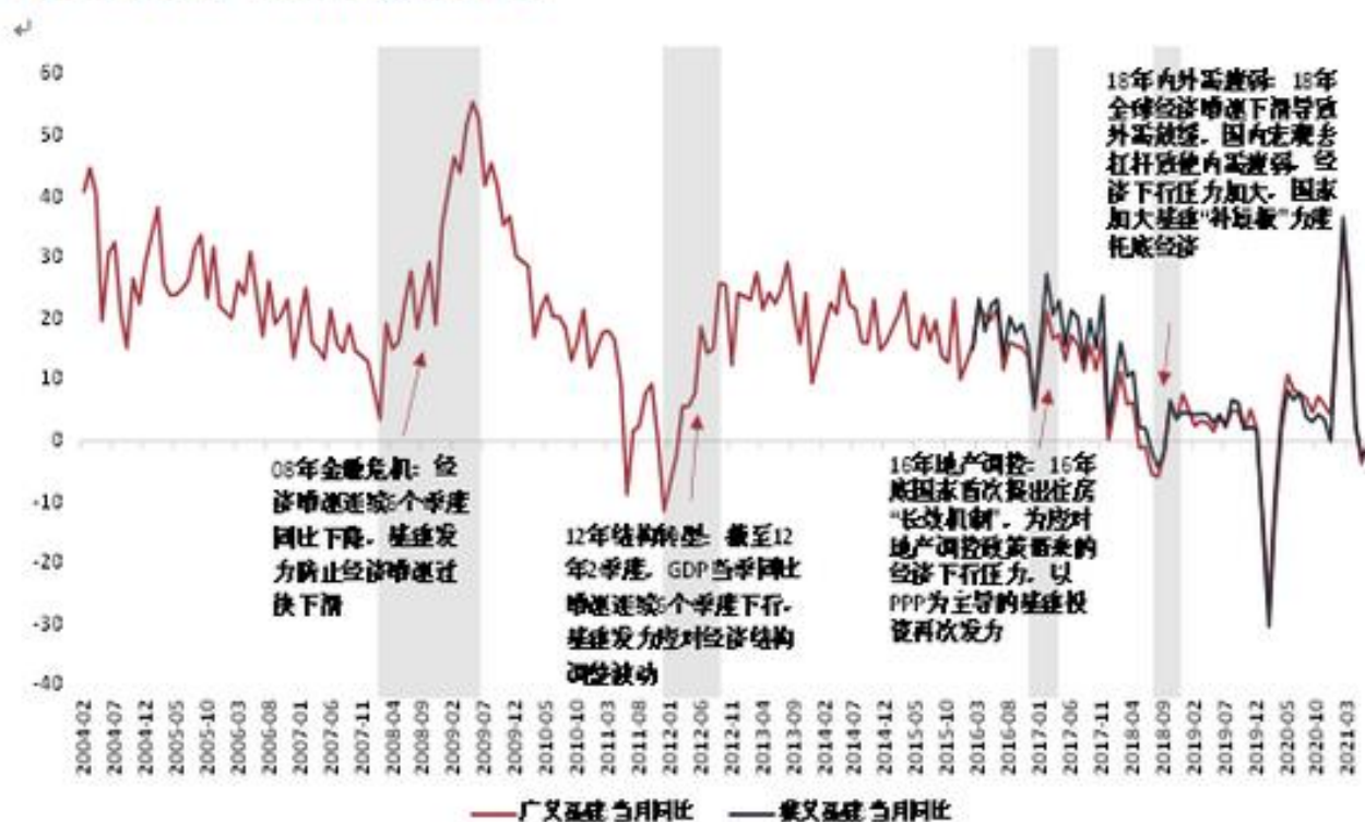
图 2：过去 20 年来的四次基建扩张

从历史上看，基建投资都是“逆周期”调控和“稳增长”的主要政策工具。从过去 20 年，我国 4 次基建扩张的情况来看，通过基建支持经济往往发生在经济周期中经济增速下行压力较大的阶段（图 2）。而今年上半年中国经济已经实现了较平稳且持续的恢复。因此，财政逆周期发力的必要性不是非常高。同时，财政资源后置有利于平衡财政收支，为下半年和明年财政政策留有更大空间。